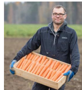
Lietlahden tila, www.lietlahti.fi