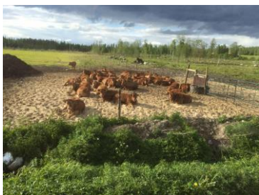
Harjun Maatalous Oy, facebook.com/HarjunLuomuOy