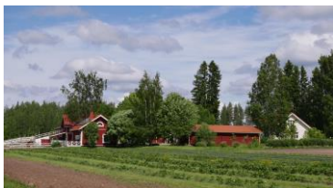
Vertin tila, www.vertti.fi , facebook.com/vertintila