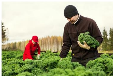
Kalliolan luomu, www.kalliolanluomu.fi , facebook.com/kalliolanluomu