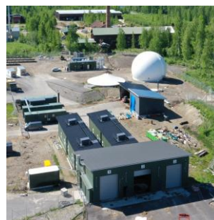
BioHauki Oy, www.biohauki.fi , facebook.com/BioHauki